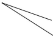
附表三 工程管理曲线